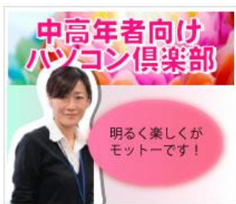
中高年者向けパソコン倶楽部