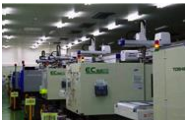
プラスチック成形工程