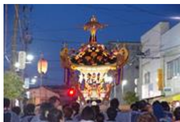
花巻まつり参加の神輿

「ソフトボール大会」「ウォーキング大会」「花巻まつり」など、数多くのレクリエーションによる、社員相互の融和や、「里山整備」「豊沢川クリーン作戦」「はなまき産業大博覧会」などへ、積極的に参加し、社会貢献に寄与しています。