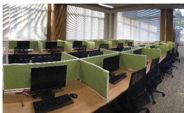
オペレーションルーム