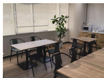
リフレッシュルーム