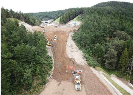
三陸復興道路現場