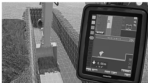
(ICT 建機の操縦室画面)

当社の職員はこれらの最新技術を身につけ、どこでも通用する技術者へと育てていきます。その結果、技術力が向上し、国土交通省より工事成績優企業に認定されています。