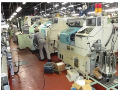
自作ラインの整備中

金属の精密加工とともに、加工設備の設計・製作も自社で行っています。工夫しながら設備を自社で改良・保全していることが特徴です。加工・洗浄の自動化、全数自動測定検査により