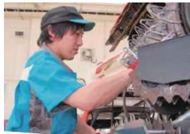
コンバインの整備

農業機械から水・環境システム、社会インフラ関連製品まで扱っています。販売した機械をお客様に最も効率的に長く使っていただくために、定期的な点検や補修を積極的に実施しています。 きめ細かなメンテナンスサービス がお客様の信頼を高める源となっています。