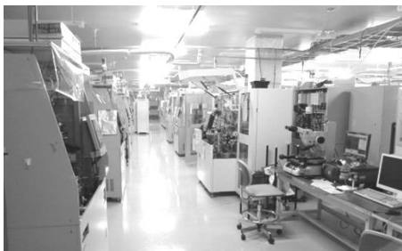
電子事業（半導体実装） クリーンルーム