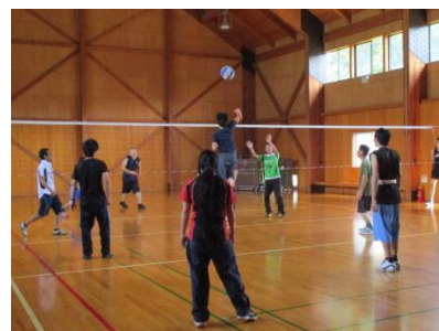
バレーボール大会