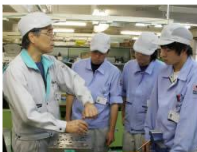
ベテラン技術者による若手指導