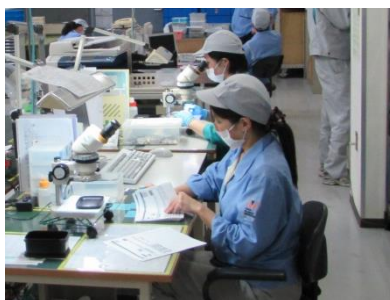
多くの女性が活躍