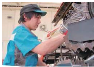
コンバインの整備

農業機械から水・環境システム、社会インフラ関連製品まで扱っています。販売した機械をお客様に最も効率的に長く使っていただくために、定期的な点検や補修を積極的に実施しています。 きめ細かなメンテナンスサービス がお客様の信頼を高める源となっています。