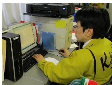
発注や部門の計数管理

スーパーマーケットの仕事は、陳列やレジ精算だけではありません。調理・加工はもちろん、計数管理からの分析、計画、発注予測等、 バックヤードでの業務も、 重要です。