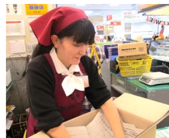
女性チーフが活躍