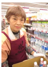
売場での陳列・作業場での値付け

育児休業取得 100%、介護休暇の実績もあり、家庭と仕事を両立しやすい職場づくりに努めています。