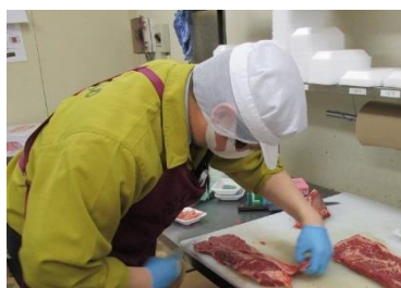
生鮮部門での加工作業