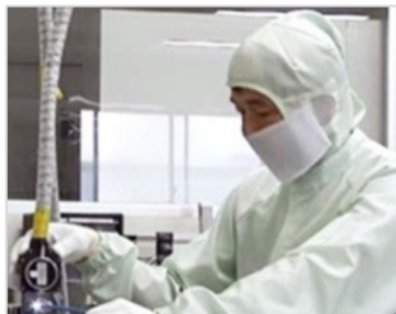
設備工事の配管検査