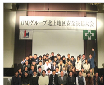
安全大会(年始懇親会)で交流