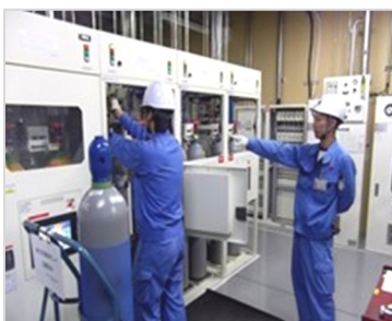
ボンベ交換、安全よし！