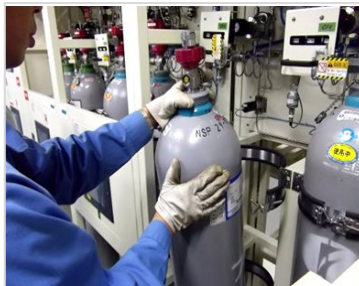
ガスボンベ交換作業

半導体製造工場への配管工事、ガス供給装置製造、ガス/薬品の供給管理まで、「 トータルファシリティマネジメント (TFM) 」として供給に関する一貫したサービスを提供、お客様のものづくりを支えています。