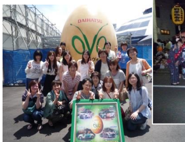
「オーヴォ」観覧ツアー

職員親睦会があり、毎年、旅行が企画され多くの職員が参加しています。またお花見会やボウリング大会などを企画し、年代や職種を超えて親睦を深め楽しんでいます。