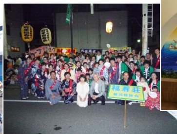
水沢ざつつあか祭りに参加