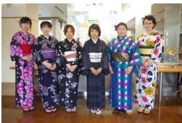
ビアガーデンで浴衣姿の女性職員