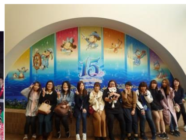
ディズニーリゾート旅行