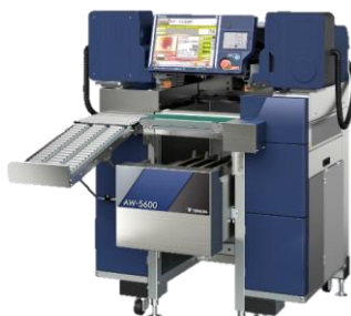
自動計量包装値付機