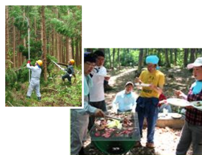
『企業の森活動』では枝打ちや下草刈りを行います。終わったあとはバーベキューでお疲れさま！