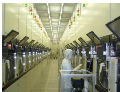
半導体はクリーンルームで製造