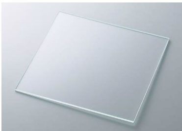
成膜前のガラス基板