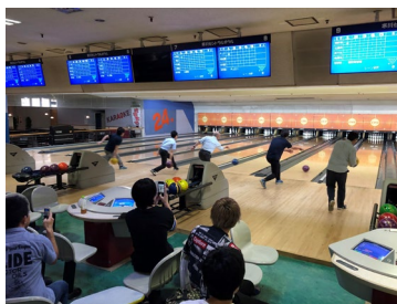
社内ボウリング大会