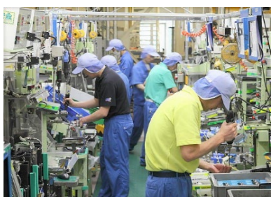
組付け製造ラインの作業風景