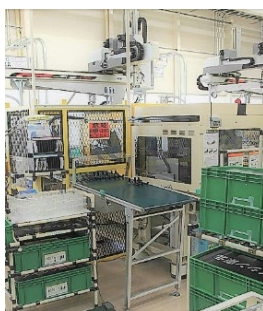
成型後完成品がコンベアで送られる様 子。この後に作業者が品質チェック。

自動車に搭載される部位により 作業工程は異なりますが、部品の 組付・造形・巻線・接 合 といった加工を行っています。