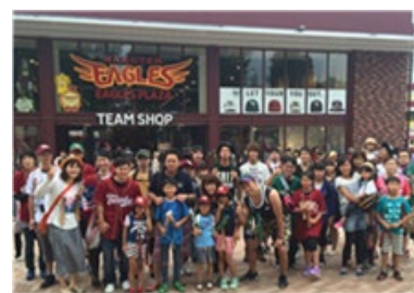
楽天イーグルスの野球観戦 '16年