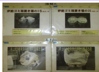
安全の基本、整理・整頓を地道に