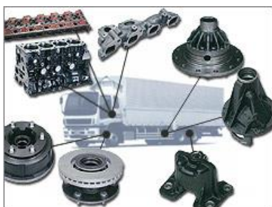
トラックの部品を製造