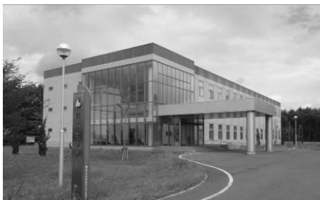
研究開発を行う技術センター