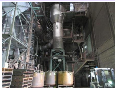
使用済の砂のリサイクルを推進

職場ごとに作業環境の改善に取り組み、安全に作業ができるよう、整理・整頓を実施しています。