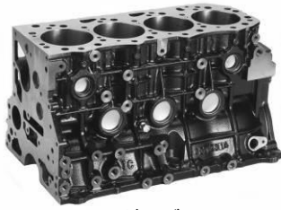
シリンダーブロック