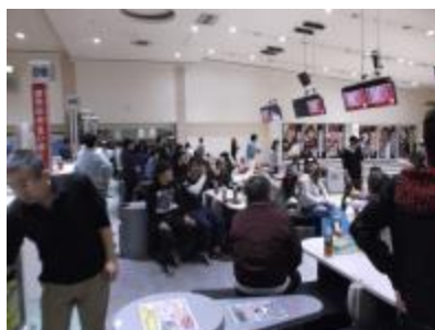
新入社員とボウリング♪

また、宮城県大衡村にある“大衡の森”での植樹ボランティアなどさまざまな活動にも毎年参加をしています。