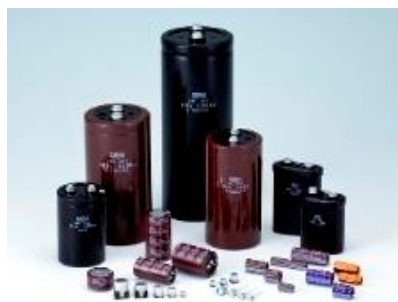
アルミ電解コンデンサ