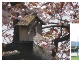
会社敷地内の巣箱

地域に根ざした企業として、近隣の自然環境保護や、生物多様性保全活動に取り組んでいます。会社敷地内に鳥の巣箱をつけたり、ビオトープを作って北上川水系の絶滅危惧種である「ミナミメダカ」の保護を行っています。