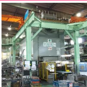
600 t プレス機