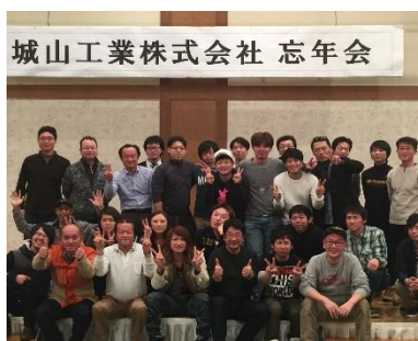
社内交流会・忘年会

歓迎会・忘年会やボーリング大会等の交流会を開催し、親睦を深め、楽しい職場づくりを目指しています。