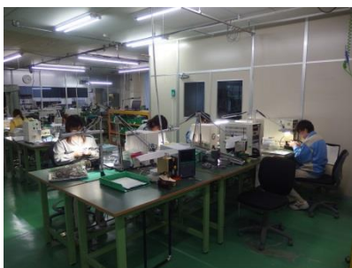
室温管理された室内での作業