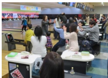
社内レクリエーションの様子