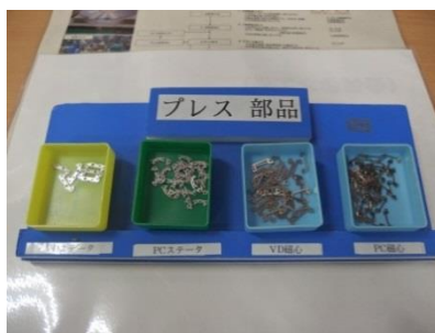
小型プレスによる部品製造

セイコーホールディングスグループ向けの機械式、クォーツ式腕時計に使用される部品の製造を行っています。製造された部品は盛岡セイコー工業(株)に納入され、グランドセイコーなどの 高級腕時計 にも使用されます。