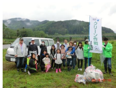
ゴミ拾いにも参加