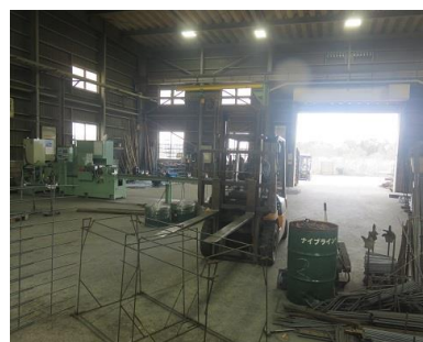
多様な技術が身に付きます