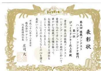
〔植栽コンテスト第1位〕

スタッフは自分自身を磨き成長させようと取り組んでおり、びっくりドンキー300店以上が参加した植栽コンテストで、北上店は平成27年度、平成28年度に全国第1位を受賞しています。