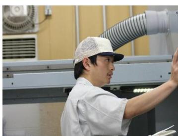
〔機械加工による切削加工〕

プラスチック材料を、機械を使用している 切削加工 や、手加工で 接着・曲げ・溶接加工 などで製品を製作しています。