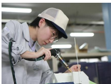
〔手加工による溶接加工〕