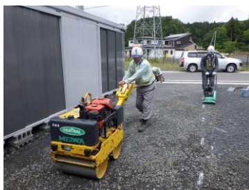
小型重機を使用した舗装

10代~60代まで 幅広い世代が活躍 しています。仕事で分からないことがあれば、何でも気軽に相談できる!!そんな職場を自負しています。