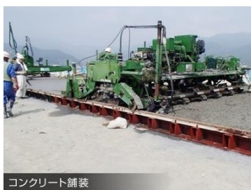
コンクリート舗装