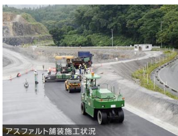
アスファルト舗装施工状況