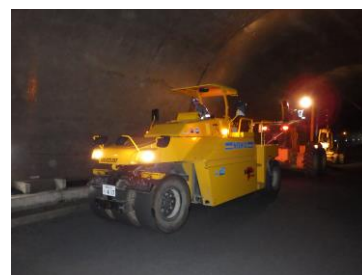
トンネル内での舗装