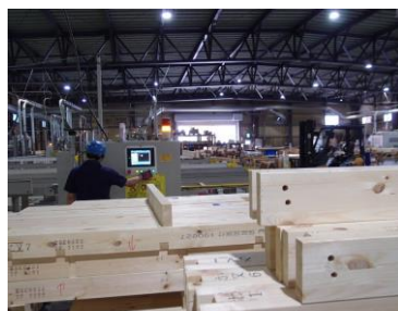
工場内での作業風景