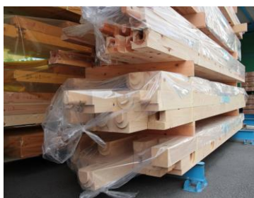
完成したプレカット製品

機械と連動したCADに入力することによって構造材を自動的に 高精度に加工 します。2016年12月に設備を入れ替え、2017年にはサイディングプレカット（外壁加工）も導入し、様々なニーズに対応しています。