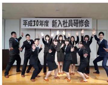
約 2 か月間に及ぶ新人研修

『いわて子育てにやさしい企業』、『いわて健康経営認定事業所』認定、『いわて働き方改革 AWARD2018/個別プロジェクト賞(子育て部門)』受賞企業です。