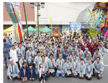
一関夏まつり神輿渡御