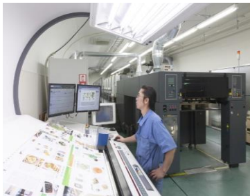
業界最先端の設備を誇る工場