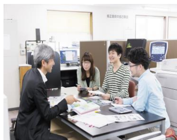
自由な発想がものづくりの原点

信頼の歴史と高い技術力を武器に、▶総合印刷▶メディアプロデュース▶企画・マーケティング▶看板・店舗装飾▶紙製什器▶デジタルアーカイブ▶空間ディスプレイ等、マルチメディアな企画提案でお客様の情報伝達活動をサポートしています。