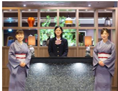
笑顔のおもてなし