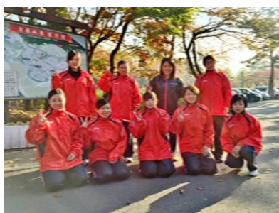
元気に活動する陸上部