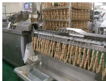
ウインナー充填工程

製造部門は「原料処理」「充填」「熱処理」「包装」「品質検査」「箱詰め」などの重要な各製造ラインの協力体制で商品の生産を行っています。機械化も進んでいる工場ですが、やはり、人と人とのコミュニケーションが何より重要です。