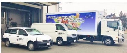
営業用及び物流車輛