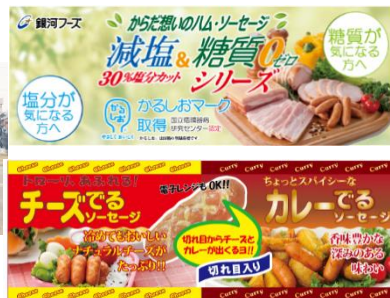
弊社こだわりの代表商品

弊社は「ハム・ソーセージ」の製造部門、本社スタッフ部門と営業部門の 大きく 3 部門 があります。製造は花巻市の本社工場で生産業務を行います。営業は、北は青森県から南は新潟・関東圏まで、主にスーパー量販店向けに提案商談をするのがメインの業務内容です。