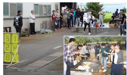
秋 BBQ でのストラックアウト