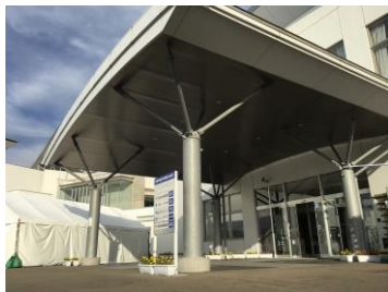
花巻総合体育館 玄関柱