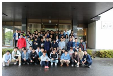
春の親睦行事 矢びつ温泉

春と秋の年2回、社員交流を目的とした親睦行事を開催しています。社員で毎年アイデアを出し合い、楽しめる「イベント」を企画しています。