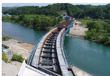
閉伊川横断橋 (北日本機械特定JV)