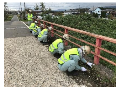
創立記念日ボランティア (橋梁点検・清掃の様子)