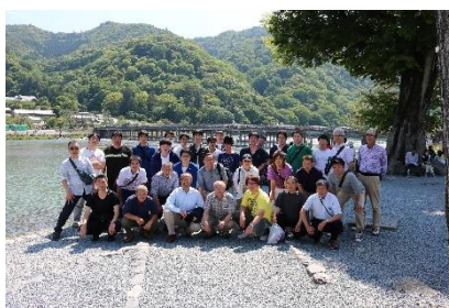
社員旅行 (奈良、京都、神戸、大阪)

花巻まつりの神輿パレードや創立記念日における橋梁清掃ボランティアなど、各種ボランティア活動に参加し、地域との繋がりを大切にしています。また、社内勉強会の開催や、各種資格取得の支援を積極的に進めています。