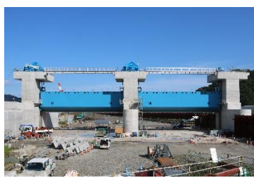
甲子川水門 (丸島アクアシステム特定JV)