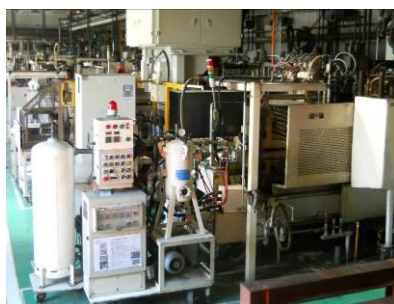
高い技術力で特殊な部品を製造

当社では、自動車用エンジン機器やブレーキ製品の部品を世に送り出すとともに、オイルポンプ・ウォーターポンプ等の加工組立品も生産しています。