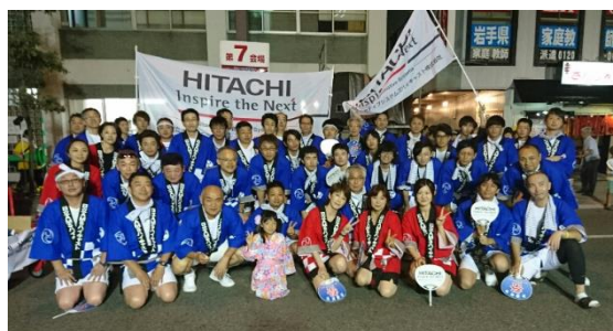
北上・みちのく芸能まつり

野球部の各種試合参加や、北上・みちのく芸能まつりへの参加など、陽気で笑顔のある職場です。