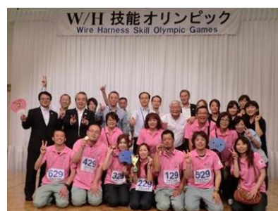
ワイヤーハーネス技能オリンピック