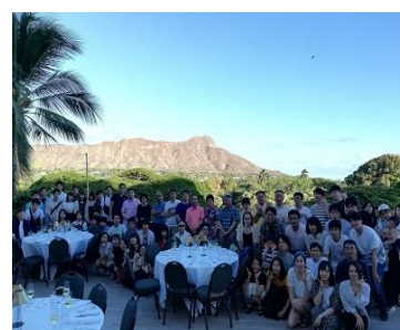
〔社員旅行（コロナ前）〕