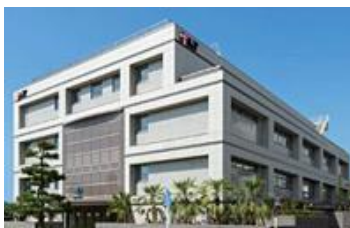
本社(神奈川県平塚市)