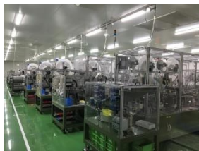
コネクタ組立工程