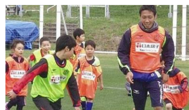
スポーツ振興にも力を注いでいます