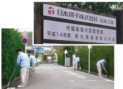
近隣の清掃活動（大磯工場）

花泉工場は、「地球環境との調和を目指す」生産施設として設立され、全従業員が緑化運動に努め、緑化優良工場として内閣総理大臣表彰を授与されました。また、当社はスポーツ振興を通じた青少年の育成活動にも力を注いでいます。