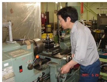
汎用旋盤を使いものづくりの基礎を学びます

安全教育や、ものづくり用語、工作機械の使い方などベテランの先輩がしっかり指導してくれます。近年では当社のものづくりの現場でも、女性や若手社員が活躍する場が広がっています。