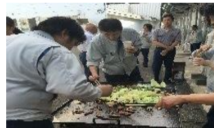
初めてバーベキュー大会の幹事をしました