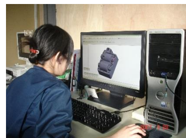
三次元CADで設計します