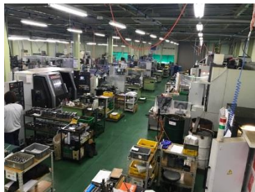
工作機械で高精度部品を作ります