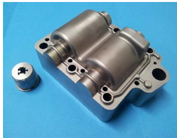
自動車産業用の金型部品

鉄やステンレス、アルミなどの材料を工作機械で高精度の部品を製作しています。当社の工場で作られた製品は、国内外で使用され、産業を支える 重要部品が花巻の地域から 生まれています。