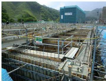
大槌消防庁舎建設(建築主体)工事 基礎型枠施工状況

主に建設現場で RC 建築物や土木構造物を作るために使われる コンクリートを成型する為に必要となる「型枠」を作っています 。コンクリートは工場から出荷した時は液体に近い状態になっているので、構造物として固まって形状を保つまでの間、型枠が必要となります。