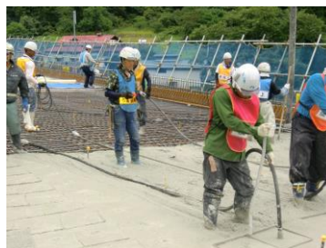
コンクリート打設状況