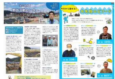
社内報 TK plus 現場紹介や失敗談の紹介など