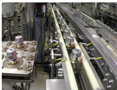
スプリンクラー組立ライン