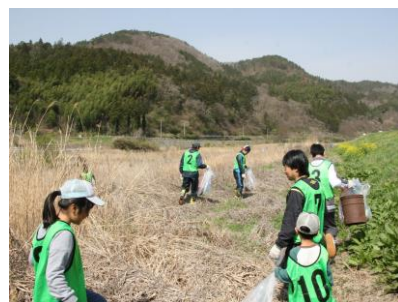
砂鉄川清掃活動に参加