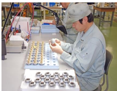
目視による外観検査

スプリンクラーヘッドは、万一、火災が発生すれば確実に作動しなければなりません。また、その時までは漏水や誤作動は絶対に許されない、きわめて 重い製品責任 を負っており、厳重かつトータルな品質管理が必要不可欠です。