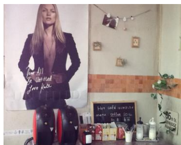
常設カフェスペース