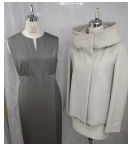
ワンピース/コート

大手ブランド 2 社を中心に、ジャケット、コート、ワンピース、ブラウスなどを商品化しています。