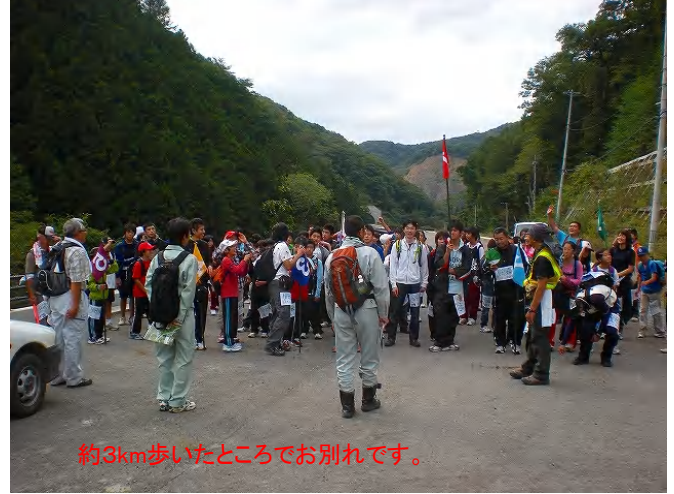
約3km歩いたところでお別れです。