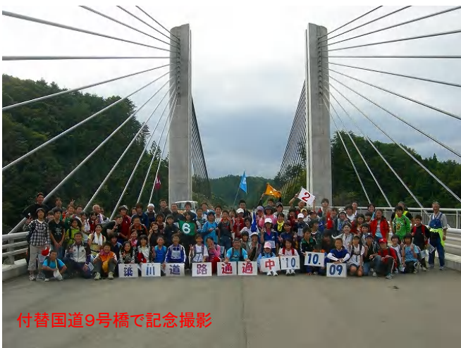
付替国道9号橋で記念撮影