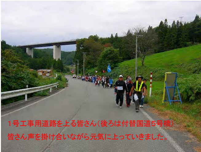
1号工事用道路を上る皆さん(後ろは付替国道5号橋) 皆さん声を掛け合いながら元気になっていきました。

開催期間中は不安定な天候でしたが、ほとんど雨にあたることなく、全員がそろって念願の浄土ヶ浜のゴールに到達したとのことです。本当にお疲れ様でした。