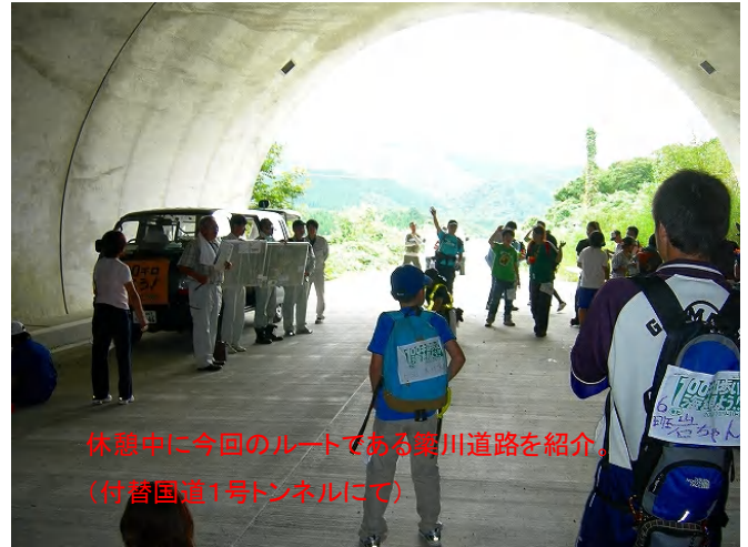
休憩中に今回のルートである築川道路を紹介。 (付替国道1号トンネルにて)