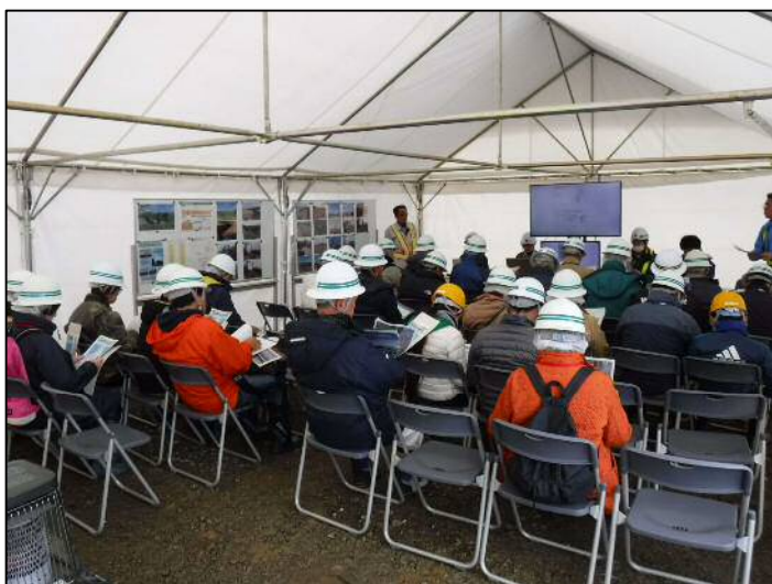
事業計画・工事概要説明