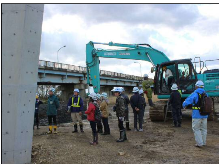
重機乗車体験・橋脚視察