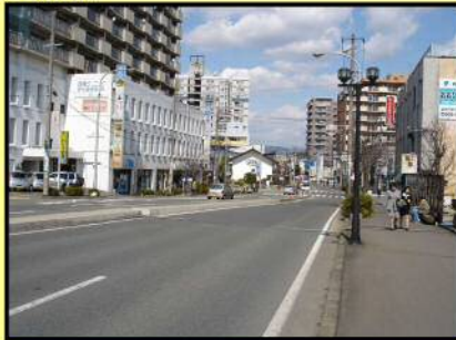
着 手 前