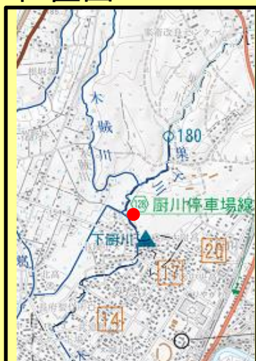
施工状況（平成30年5月現在）