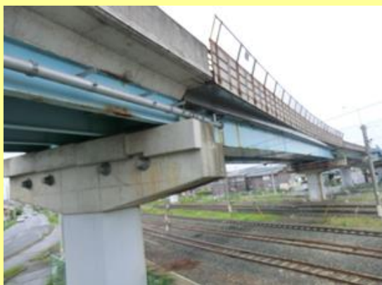
主桁・横桁腐食状況