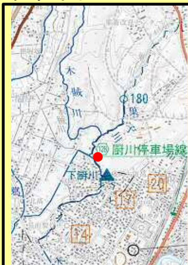
分土工施工箇所（平成29年4月現在）