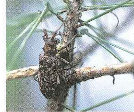
マツノマダラカミキリ(体長2~3cm)

センチュウは媒介昆虫であるマツノマダラカミキリによって運ばれてマツを枯らし、カミキリはその枯れたマツに産卵して増殖し、被害を広げます。