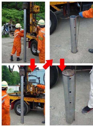
施工・測定試験状況

【実績】2014年2～3月 三陸国道事務所 越喜来地区舗装工事 【試験】 ①試験実施日:2013年5月29日ほか ②試験場所:岩手県滝沢村(現 滝沢市) 工場敷地内 ③試験目的:支柱の外側に根入長測定用の鋼管を取り付けたものが、問題なく打込み可能かどうか確認する。 ④試験方法: 打込み機を用いて土中打込みを行う。途中、回転による穴位置の微調整や支柱の前後方向への振るなど、通常の打込み時によく行う行為についても問題がないか確認する。 ⑤試験結果: 打込みによる溶接外れはなく、根入長測定用の鋼管に変形はなかった。 打込み後、支柱上部から測定棒の挿入が可能であり、根入れ深さの測定が可能であった。 打込み前のマーキング位置と、打込み後のマーキング位置が同じであり正しく根入れ長を測定できた。 ⑥考察:上記結果に加え、本試験による作業員、第三者に対する事故等の発生はなかったことにより実フィールドでの展開が可能と考える。