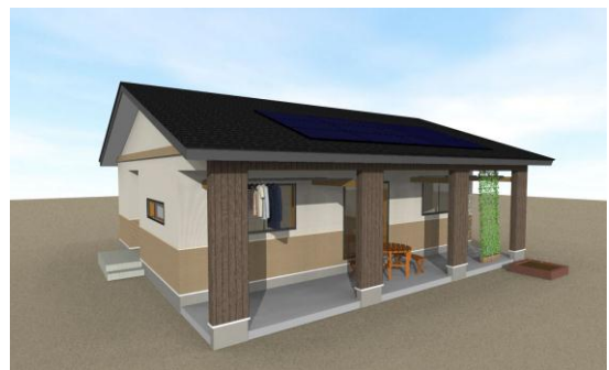
外観パース(イメージ図)