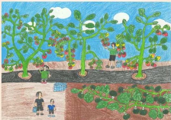
令和3年度小中学生による「美しく豊かむらづくり」 絵画コンクール 小学校高学年の部 金賞受賞作品