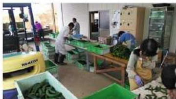
きゅうりの選別状況