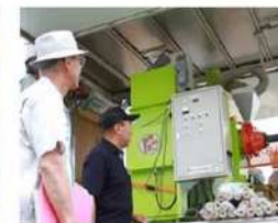
籾殻固形燃料製造機