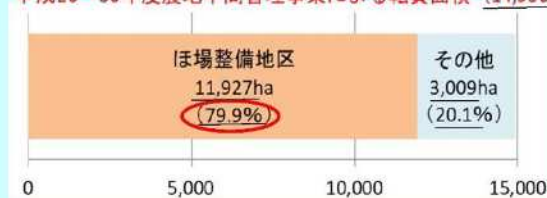
平成26～30年度農地中間管理事業による転貸面積 (14,936ha)

理由としては、整備済みのため作業効率が良く、担い手の借り入れ希望が多いことや、農地利用集積ソフト事業により集積の話し合いの場があることなどが挙げられる。