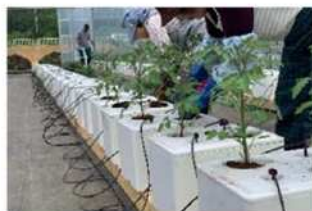
ミントマトの溶液栽培