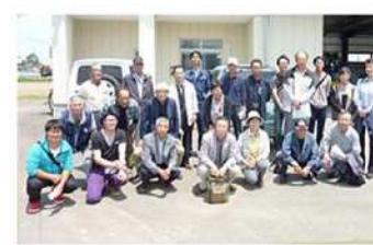
(有)鍋割川ユニオンの皆さん