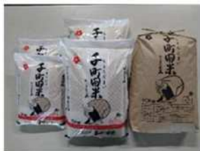
「千町田米」のパッケージ