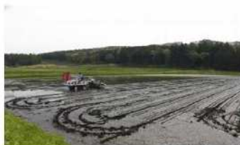
直播田植機による田植え作業