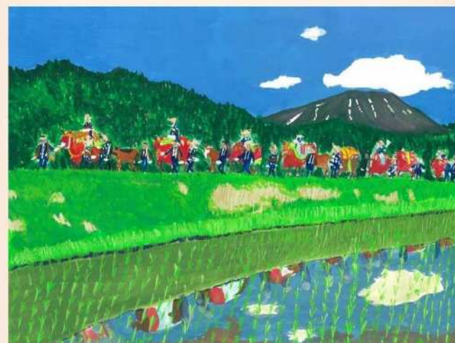
平成29年度小中学生による「美しく豊かむらづくり」 絵画コンクール 小学校高学年の部 金賞受賞作品