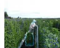
りんどう収穫作業