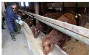
粃米サイレージを給餌