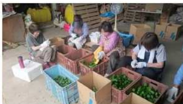
ピーマンの選果作業