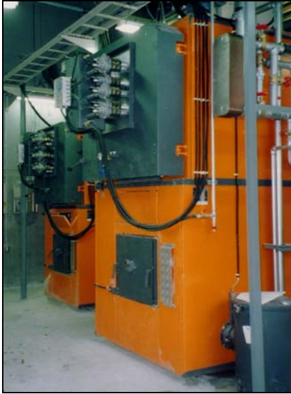
写真1 チップボイラー 左200kW 右400kW