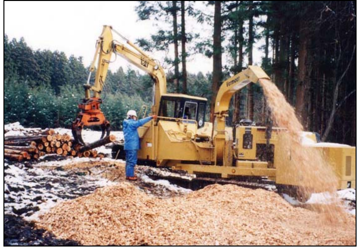
写真2 素材生産現場でのチップ化（そのまま燃料として使用可能）