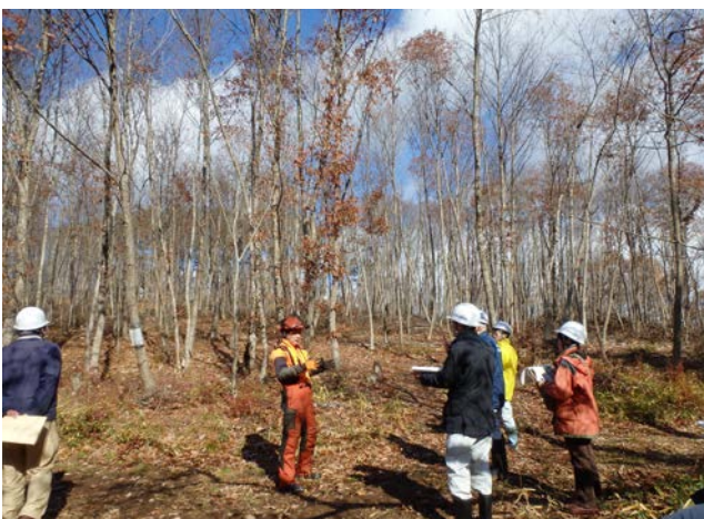
施工地の調査状況