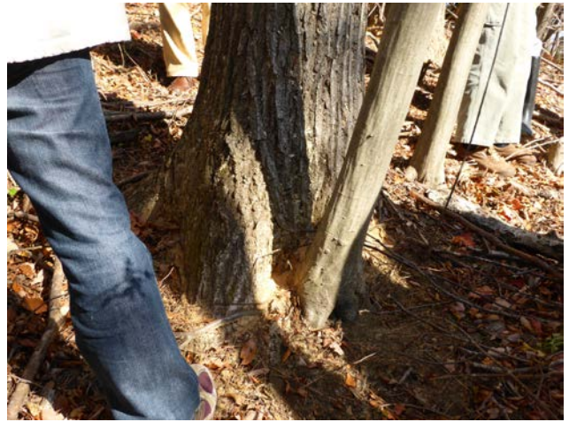
フラス（木くず）の発生状況