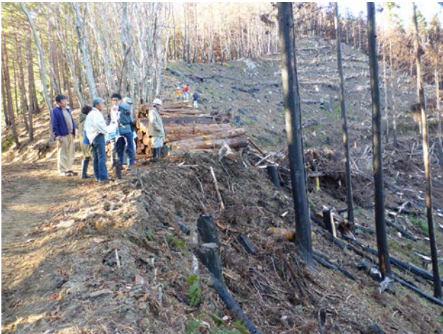
被害木伐採状況の視察