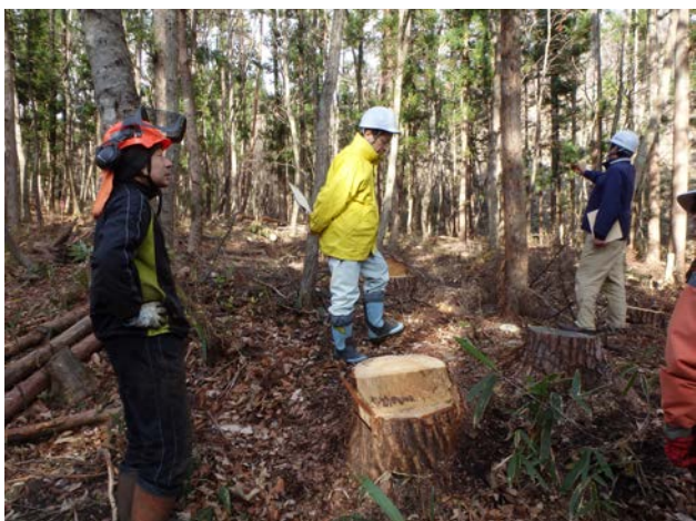
千葉代表による概況説明