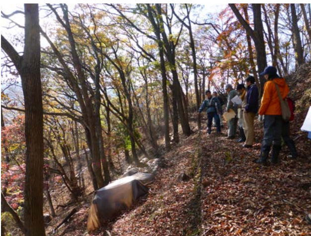
伐倒くん蒸による駆除