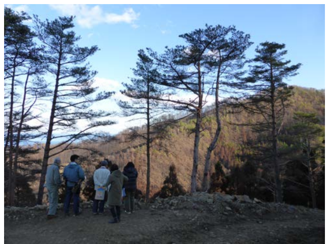
環境の森整備事業施工地（遠景）