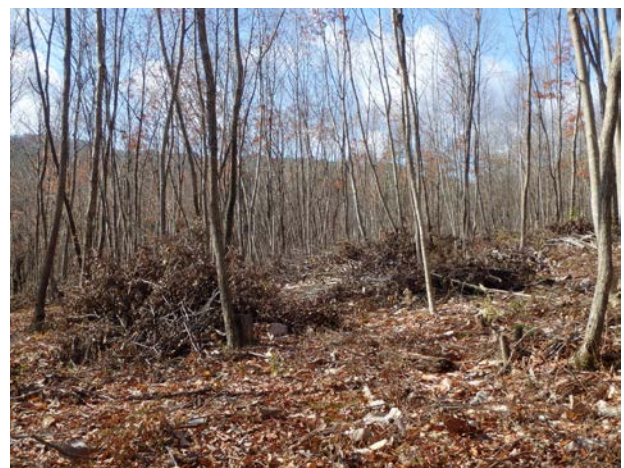
除間伐木の集積状況