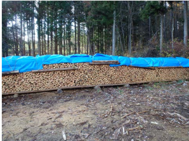
間伐材を活用した薪