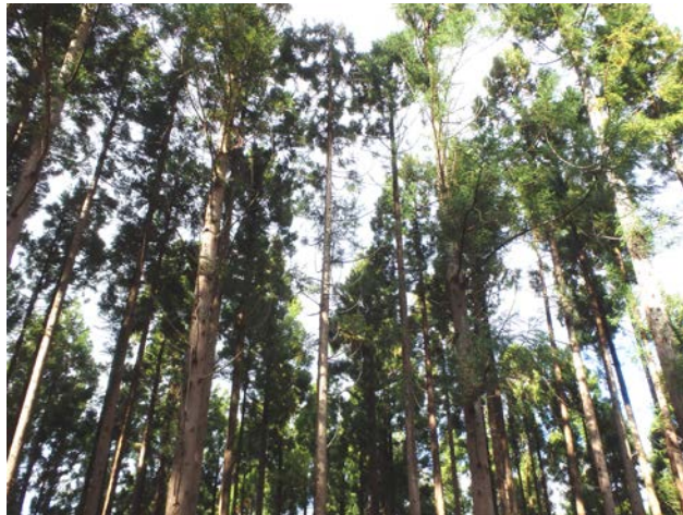
間伐実施後の状況